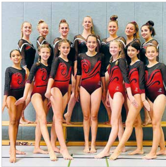
Gaumannschaftsmeisterschaften der Gerätturnerinnen