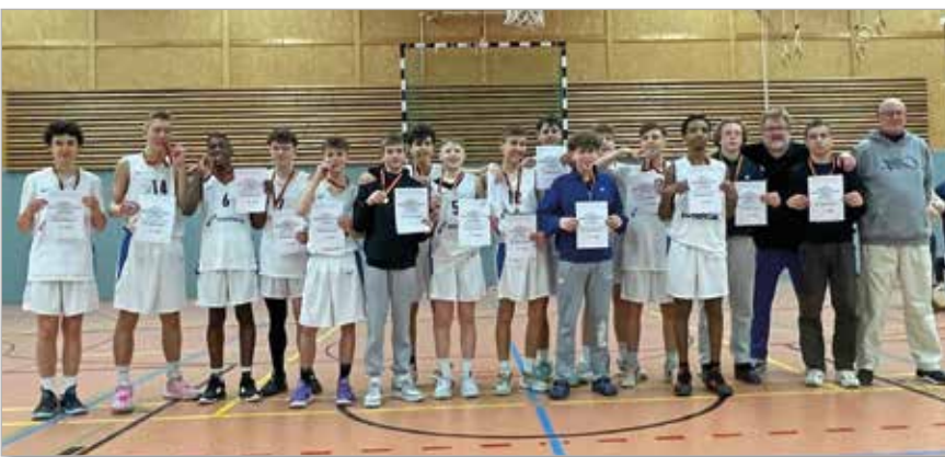
Die Hessenmeister des Jahres 2023 – die mU16 der SG Weiterstadt.

Frisch gekürt als Oberligameister ging das U16 Team als Favorit ins um die in der heimischen Adam-Danz-Halle ausgespielte Hessenmeisterschaft. Dort traf man auf Gegner in Form des TG Naurod, Eintracht Frankfurt und HTG Bad Homburg.