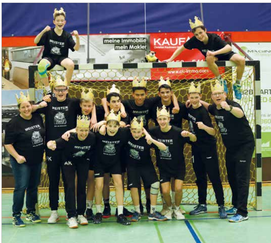
Männliche C-Jugend