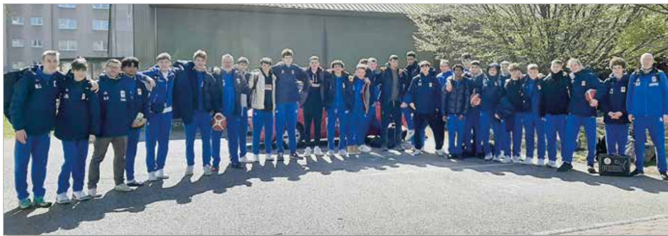
Erfolgreiche Vertreter ihrer Farben – die Teams der U16, U18 und U20 beim Turnier in Wien

Das internationale Basketball Jugendturnier in Wien ist mittlerweile fester Bestandteil des Weiterstädter Basketballkalenders. Am frühen Montagmorgen der Osterwoche machten sich drei Teams der Altersklassen U16, U18 und U20 - mit 27 Spielern und drei Coaches - auf nach Österreich. Besonderes Augenmerk lag auf dem U20-Team, dem amtierenden Titelverteidiger. Angereist mit Vereinsbus und Bahn, untergebracht in einem schönen kleinen Hotel und verpflegt von der Wiener Gastronomie, genossen die Teams nicht nur ein tolles sportliches Event, sondern erkundeten Wien auch auf eigene Faust.