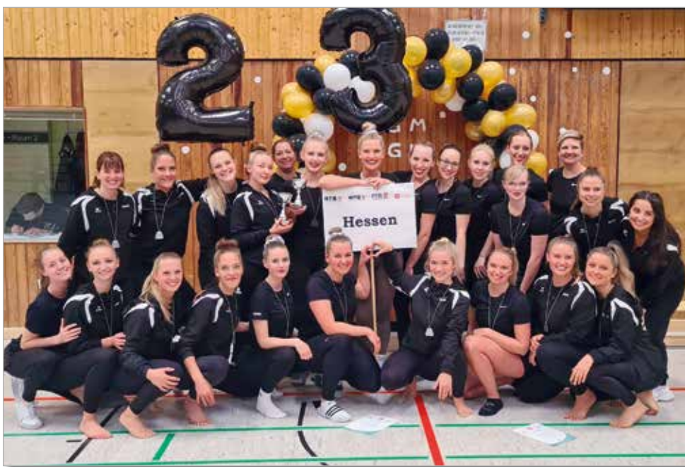
Drei-Länder-Pokal im TGW