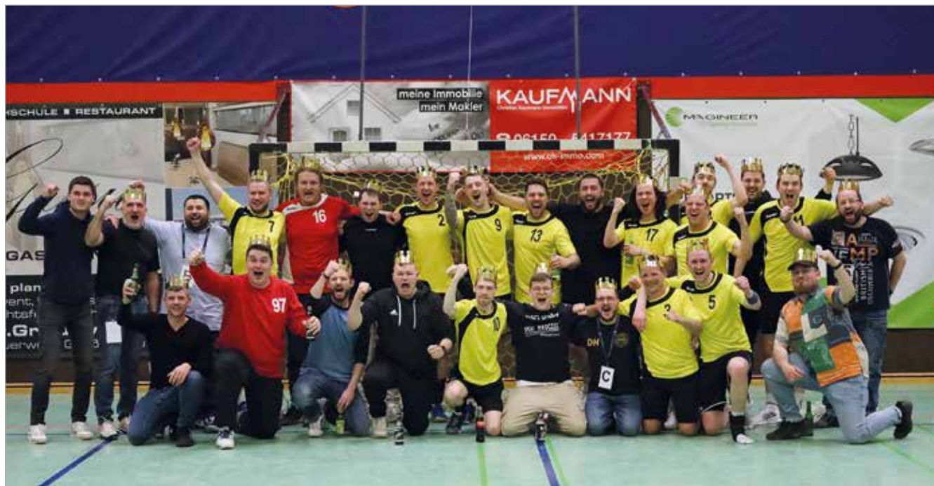
Meistermannschaft (von Michael Matthias)

Am Samstag den 29.04.2023 empfing die zweite Herrenmannschaft die zweite Mannschaft des TV Trebur zum Spiel um den Aufstieg in die Bezirksliga B. Im Hinspiel musste man sich mit 31:26 Toren geschlagen geben. Nun galt es, im Rückspiel die Punkte in Braunshardt zu behalten, um sich nach einer langen Saison mit dem Aufstieg zu belohnen.