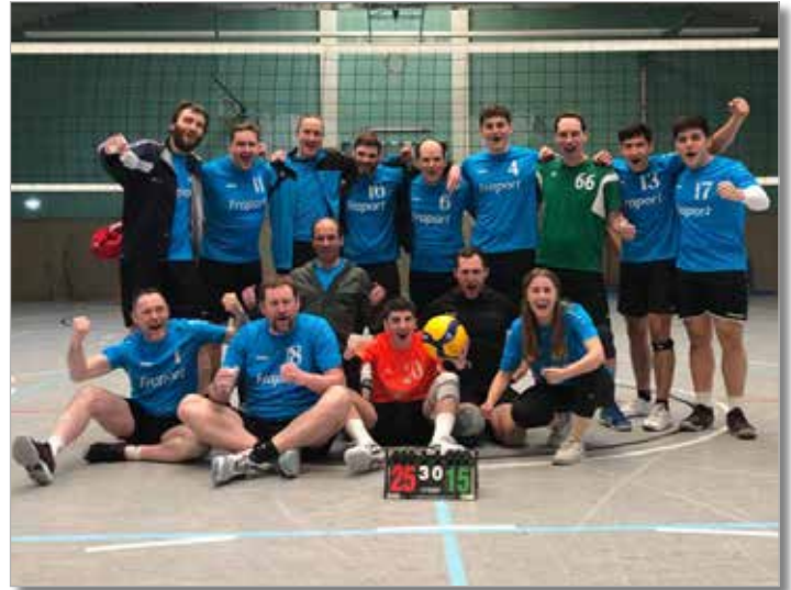
Das Landesliga-Team beendet die Saison auf einem guten 6. Platz