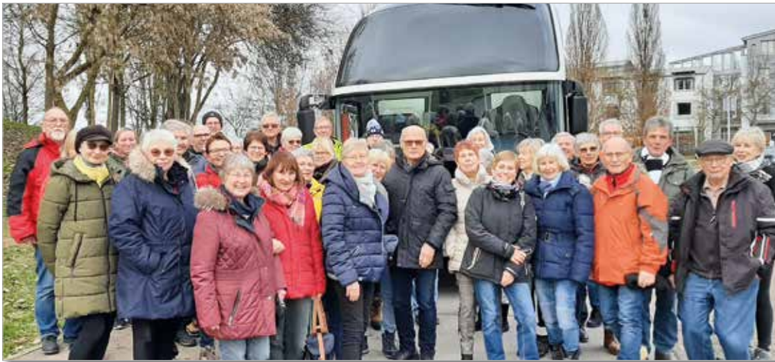
Gruppenbild, aufgenommen bei der Hinfahrt

Uhr wieder zurück nach Weiterstadt. Auch auf der Heimfahrt haben wir auf unser „Weiterstädter Frühstück“ nicht verzichtet. Nach mehreren Staus vor München sind wir gegen 18.20 Uhr wieder am Aulenberg angekommen. Die Verabschiedung der Teilnehmer untereinander war recht herzlich. Zum Abschluss trafen sich noch einige der Teilnehmer im Aulenberg zum Essen. h+rs