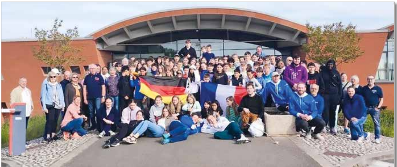
Deutsche und französische Teilnehmer und Teilnehmerinnen vor der Sporthalle in Verneuil

Der Freitag stand im Zeichen der Kultur: Paris erleben