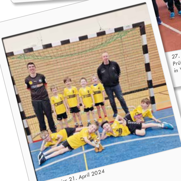
Mini-Turnier 21. April 2024