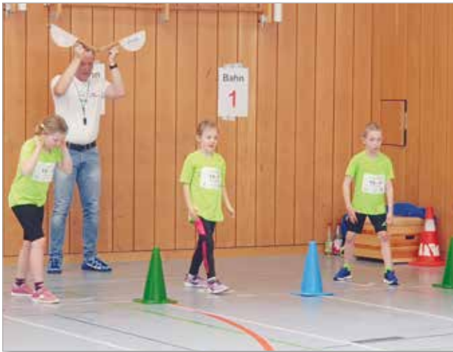
Auf die Plätze - Fertig - Los

Wir freuen uns jetzt auf den Start der Freiluftsaison und die folgenden Wettkämpfe im Juni und Juli.