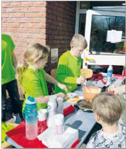
Waffelbäcker Kila Gräfenhausen