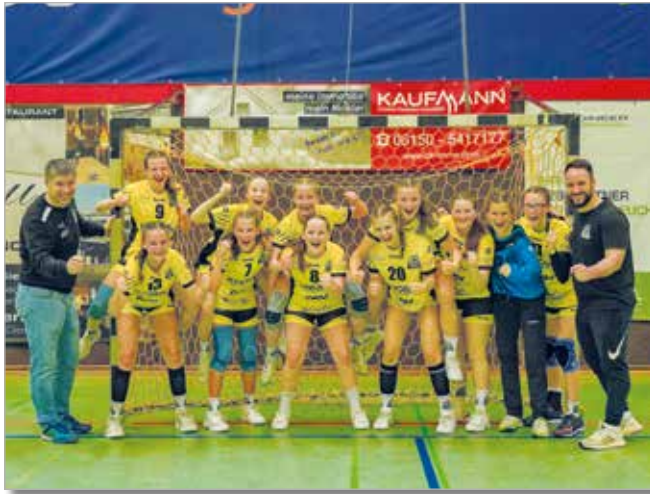
Weibliche C-Jugend Regionalligaquali