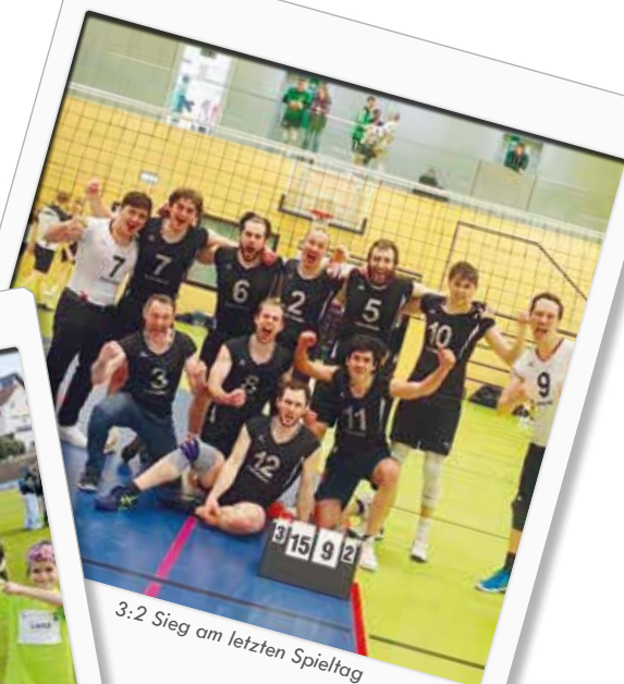
3:2 Sieg am letzten Spieltag