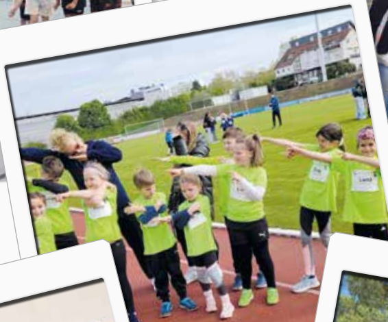
27. April 2024 Prüfungswettkampf in Wiesbaden