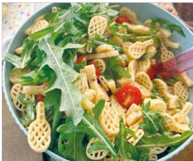
Saisoneröffnung 2024 - unser leckeres Buffet

Nach einer kurzen Begrüßung um 14.00 Uhr ging es wortwörtlich mit dem Schläger voran gleich auf die Sandplätze. Unter der Anleitung unserer Trainer konnte parallel bei einer kostenlosen Schnupperstunde erste Bälle über das Netz gespielt werden. Um 15.00 Uhr haben Kinder bis 14 Jahre ihre ersten Schläger in die Hand genommen, ab 16.00 Uhr kamen alle größeren Tennisinteressierten an die Reihe. Nach einigen spannenden Ballwechsellern und ersten Schnuppererfolgen konnten sich die Hungrigen mit leckeren gegrillten Würsten und einem einladenden Beilagenbuffet stärken. Wir bedanken uns für alle Buffetspenden und bei allen Helfer:innen für die Unterstützung vor und hinter der Theke. Noch bis in den Abend hinein haben die Hartgesottene das gute Wetter genossen und die Plätze auf die anstehende Wettspielsaison vorbereitet.