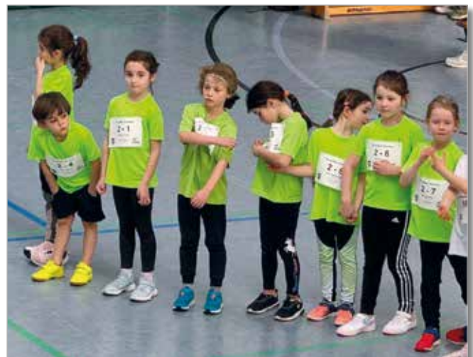
Gespanntes Warten der U8