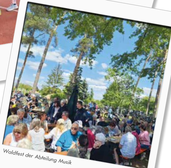
Waldfest der Abteilung Musik