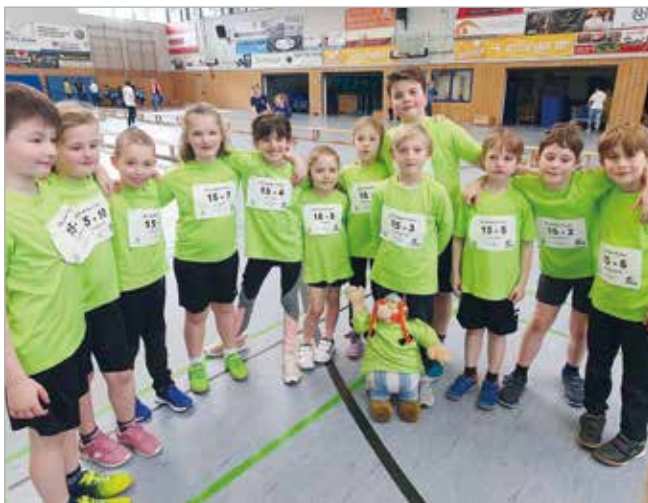
U10 Mannschaft KiLa1