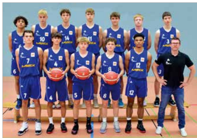
Auch in der kommenden Saison in der NBBL vertreten – Team Süd Hessen sichert Klassenerhalt

Die NBBL Nachwuchsbundesliga Mannschaft hat es geschafft das Ruder im Abstiegskampf erfolgreich herumzureißen. Nach einer enttäuschenden Gruppenphase fand man sich in der Abstiegsrunde wieder und auch dort verhiessen die ersten Spiele nichts Gutes. Doch durch die