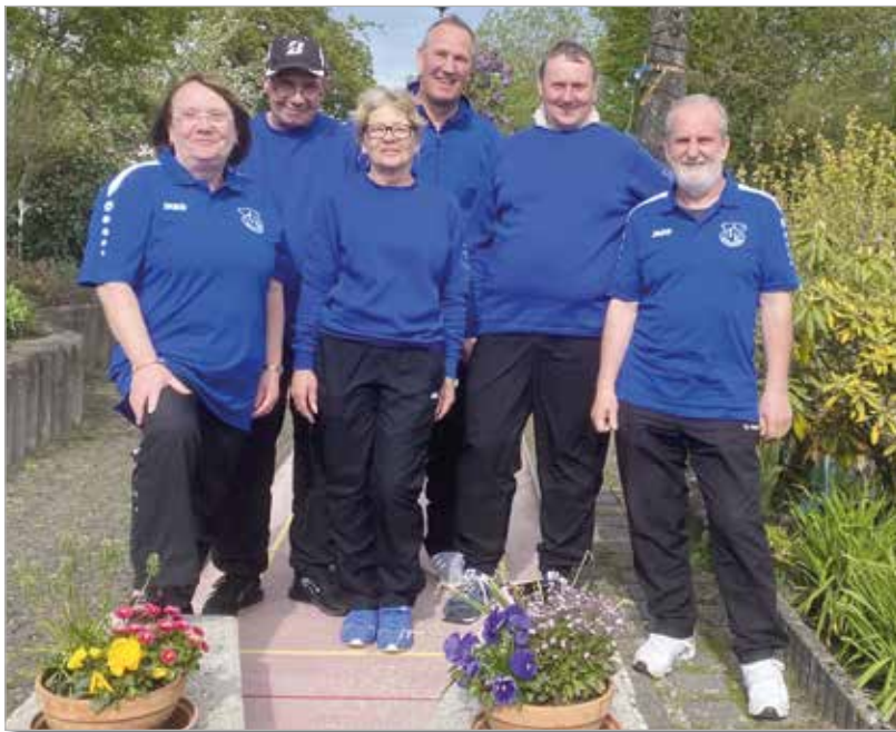
Spieltag in Bad Homburg Kirdorf

Das beste und ausgeglichene Ergebnis der Weiterstädter erspielte sich Tine. Zwar gelangen auch Ihr „nur“ sechs, fünf und nochmals sechs Assen in den drei Runden, aber an den anderen Bahnen hatte sie nicht so viele Ausreißer nach oben. Mit Rundenergebnissen von 34, 34 und