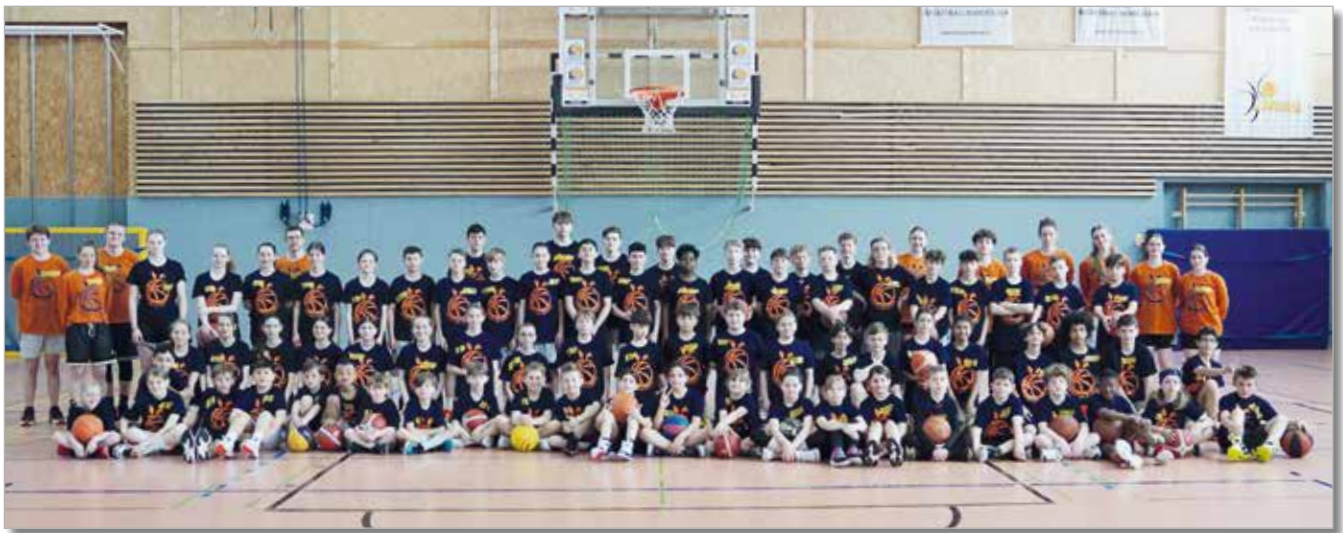
Volles Haus beim Weiterstädter Ostercamp mit über 75 Campern