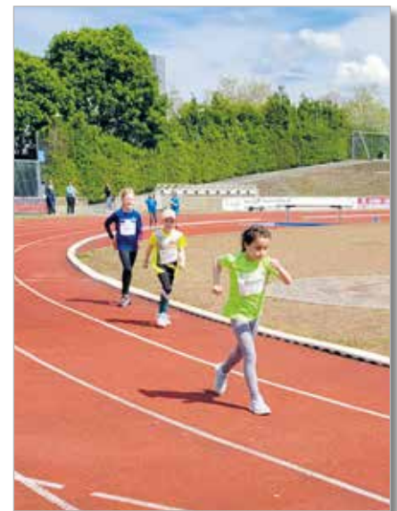
Gehstaffel in Wiesbaden